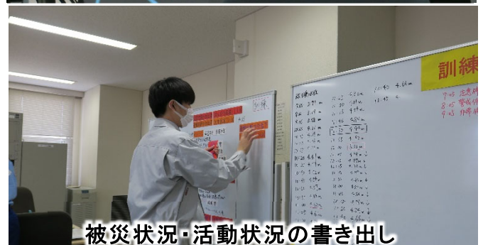
被災状況・活動状況の書き出し