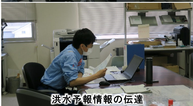
洪水予報情報の伝達