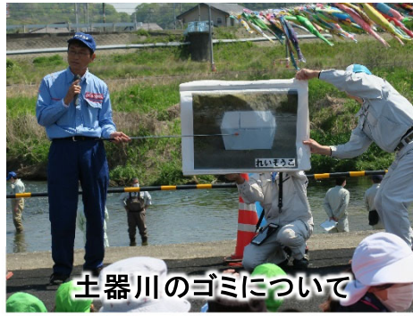
土器川のゴミについて