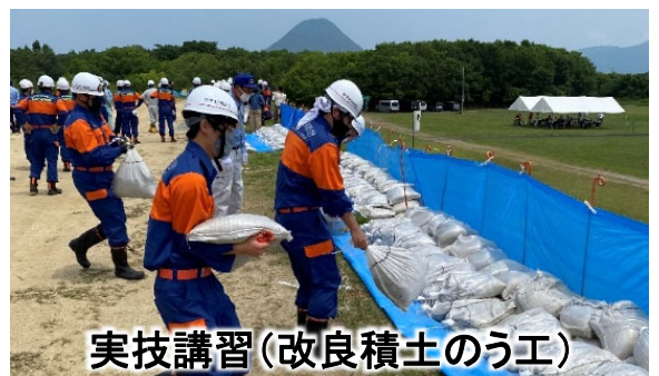
実技講習(改良積土のう工)

水防技術講習会では、流域の消防団(水防団)を対象に水防技術の維持・向上を目的とした水防工法の実技講習を四国地方防災エキスパートを講師に招いて実施しました。また、国、气象台、自治体による台風接近時に円滑な情報の共有・伝達ができるよう、WEB会議ツールを用いた情報伝達訓練を香川県立飯山高等学校の学生2名に参加いただき、行いました。