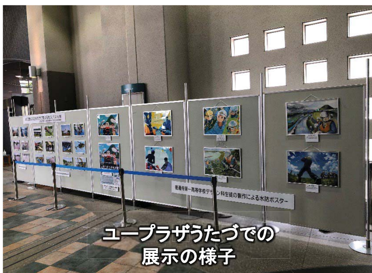
ユープラザうたづでの 展示の様子