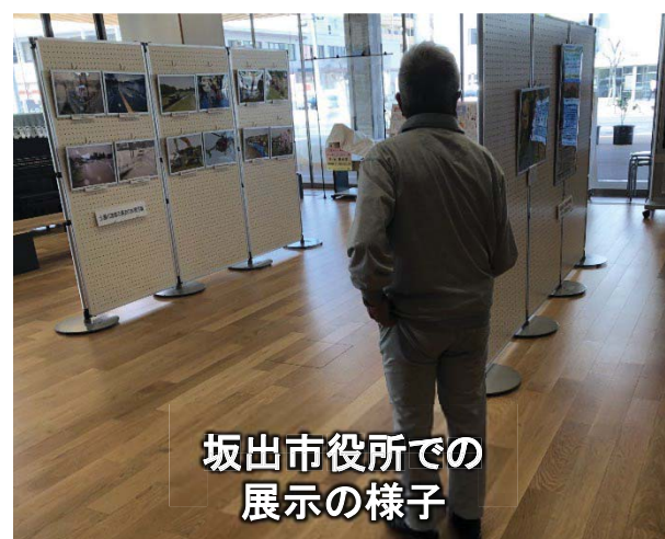
坂出市役所での 展示の様子