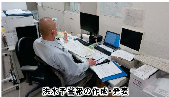
洪水予警報の作成・発表