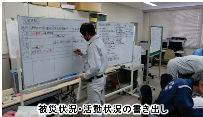
被災状況・活動状況の書き出し