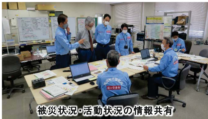
被災状況・活動状況の情報共有