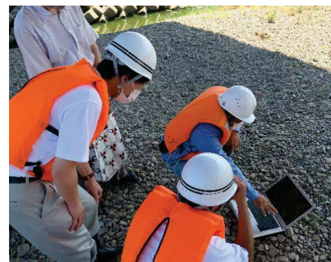
データ解析の様子

土器川リバーキーパーズ通信は、皆様のご意見・ご質問に河川管理者としてお答えしていくものです。土器川に関して、気になっていること、わからないことなど、どしどしとご意見をお寄せください。