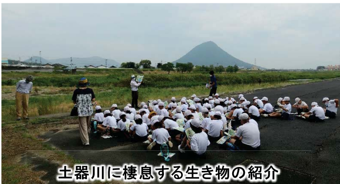
土器川に棲息する生き物の紹介