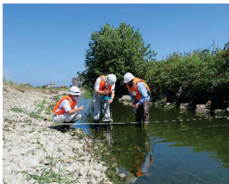
低水流量観測体験の様子