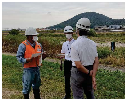
流量観測についての説明の様子

香川河川国道事務所では、8月17日～28日と9月14日～18日にかけて夏期実習生3名を招き入れました。実習期間中、職務内容を学んだ他、土器川で低水流量観測を体験し、水文情報の観測方法や、定期的な観測の重要性について学んでいただきました。