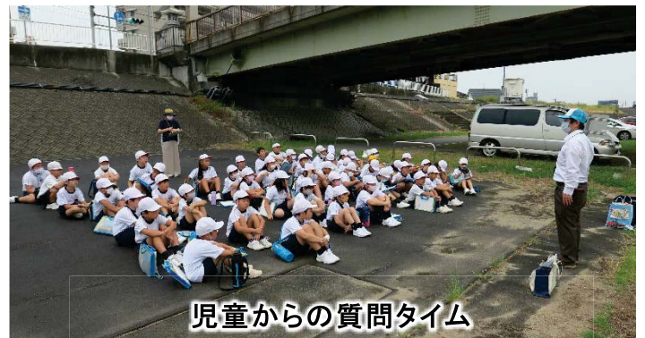
児童からの質問タイム