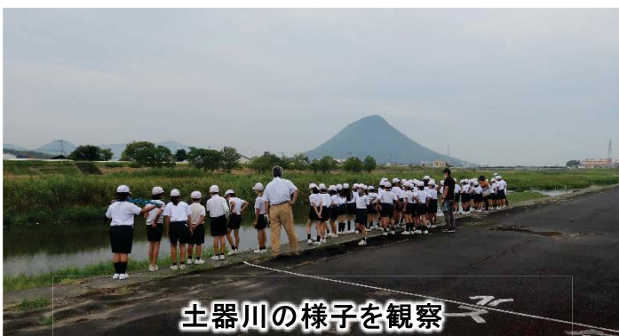
土器川の様子を観察