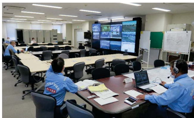
Web会議会場の様子 (第2回 土器川流域治水協議会)