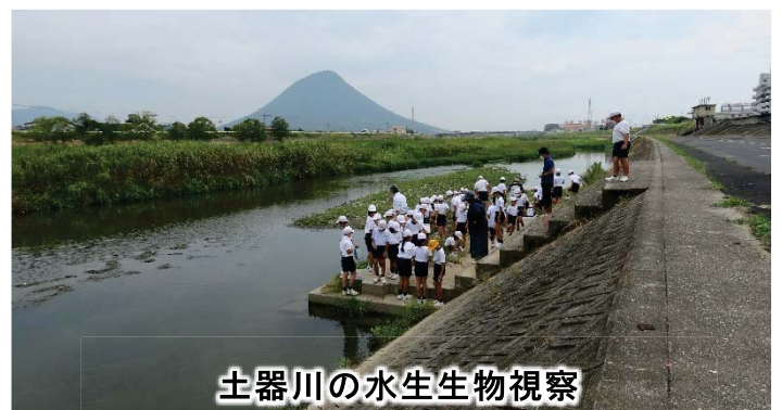
土器川の水生生物視察