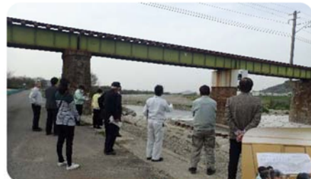
H31年度の活動状況 (現地確認)

香川河川国道事務所土器川出張所 〒763-0082 丸亀市土器町東7丁目150 TEL 0877-22-8318 丸亀市建設課 〒763-8501 丸亀市大手町2丁目3-1 TEL 0877-24-8813 まんのう町建設土地改良課 〒766-0022 仲多度郡まんのう町吉野下430 TEL 0877-73-0107