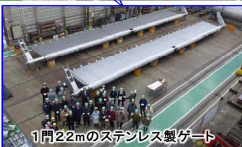
1門22mのステンレス製ゲート