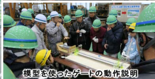
模型を使ったゲートの動作説明