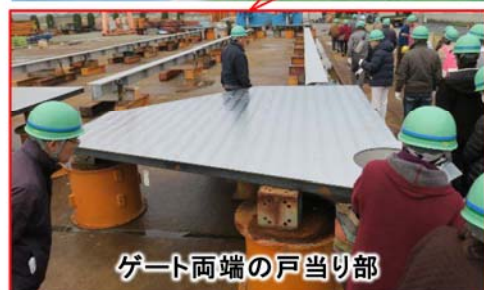
ゲート両端の戸当り部