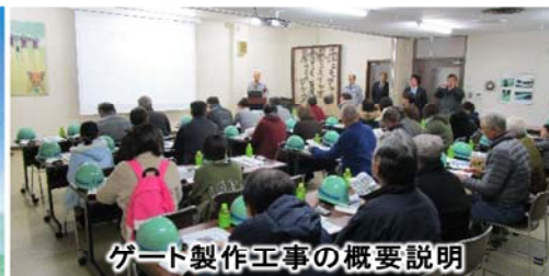
ゲート製作工事の概要説明