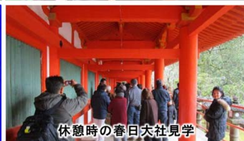
休憩時の春日大社見学