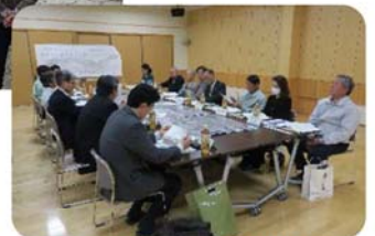
H31年度の活動状況 (意見交換会)