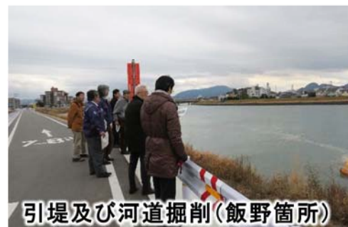
引堤及び河道掘削(飯野箇所)