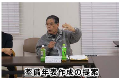
整備年表作成の提案