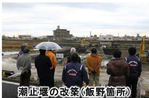
潮止堰の改築(飯野箇所)