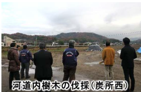
河道内樹木の伐採(炭所西)

河川整備計画に基づき適切に事業を実施していることを確認していただき、学識者の方々それぞれの専門とする分野の観点から評価して頂きました。今後も、学識者の方々の力を借りながら、適切な河川管理・改修を行います。