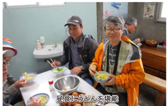
昼食にうどんを堪能