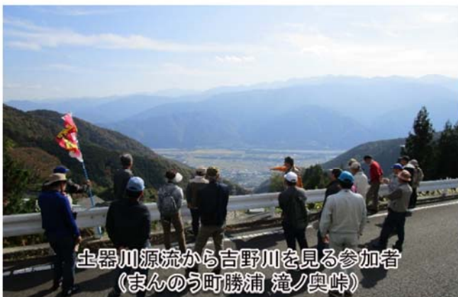
土器川源流から吉野川を見る参加者 (まんのう町勝浦 滝ノ奥峠)