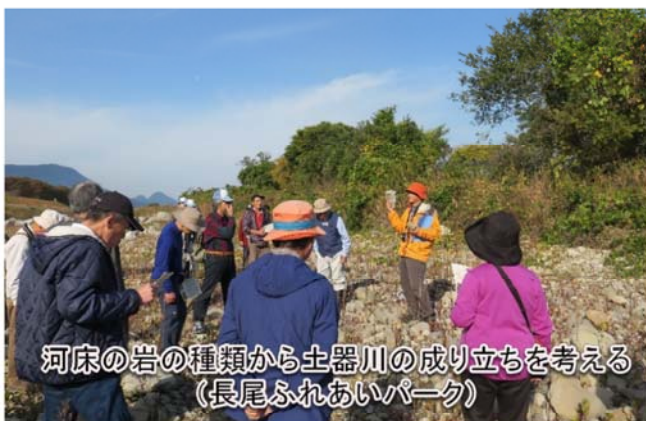
河床の岩の種類から土器川の成り立ちを考える (長尾ふれあいパーク)