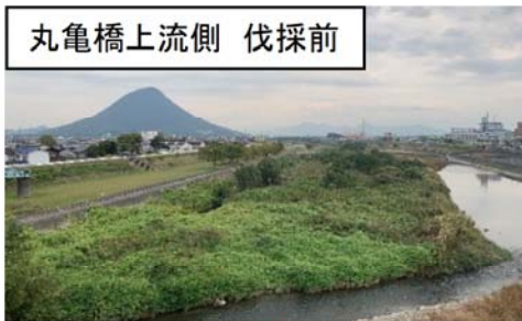
丸亀橋上流側 伐採前