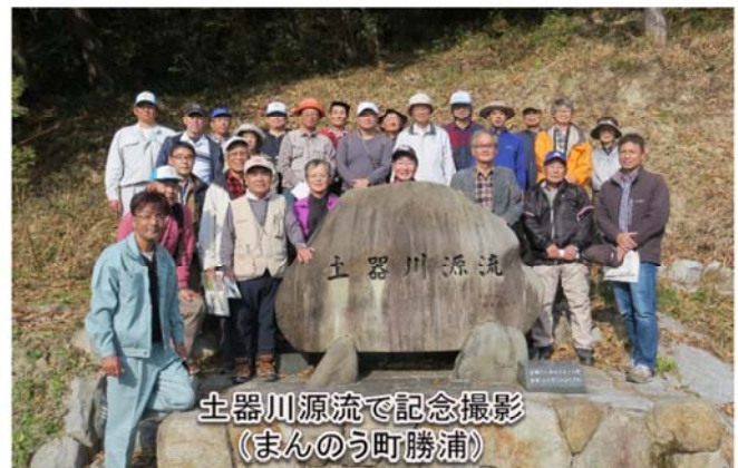
土器川源流で記念撮影 (まんのう町勝浦)