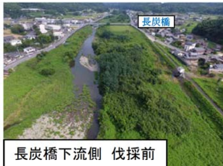
長炭橋下流側 伐採前