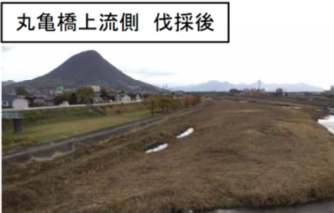
丸亀橋上流側 伐採後