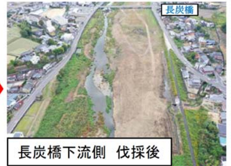
長炭橋下流側 伐採後