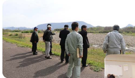
H30年度の活動状況 (現地確認)