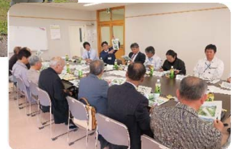
H30年度の活動状況 (意見交換会)

土器川リバーキーパーズ通信は、皆様のご意見・ご質問に河川管理者としてお答えしていくものです。土器川に関して、気になっていること、わからないことなど、どしどしとご意見をお寄せください。