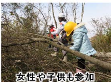
女性や子供も参加