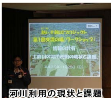
河川利用の現状と課題