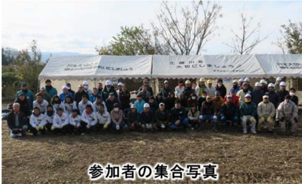
参加者の集合写真

このため、 住民と行政が協働 し、過剰に繁茂している樹木の伐採を進めることで、 土器川の利用・再生を促進 しようと、 12月9日(日) に、まんのう町長尾ふれあいパーク親水公園前の高水敷周辺で「 ボランティア伐採 」を実施しました。