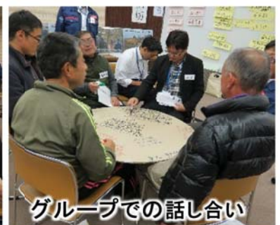
グループでの話し合い