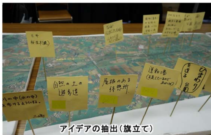
アイデアの抽出(旗立て)