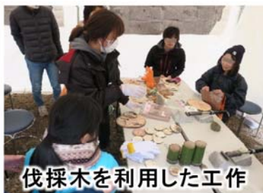
伐採木を利用した工作