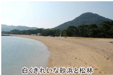
白くきれいな砂浜と松林