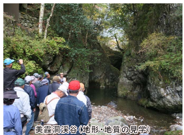
美霞洞溪谷(地形・地質の見学)