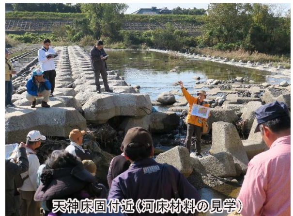
天神床回付近(河床材料の見学)