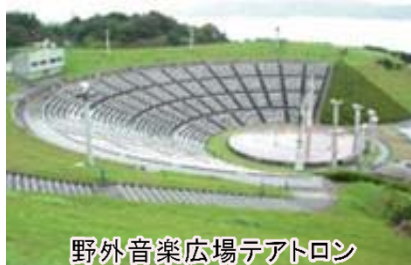
野外音楽広場テアトロン