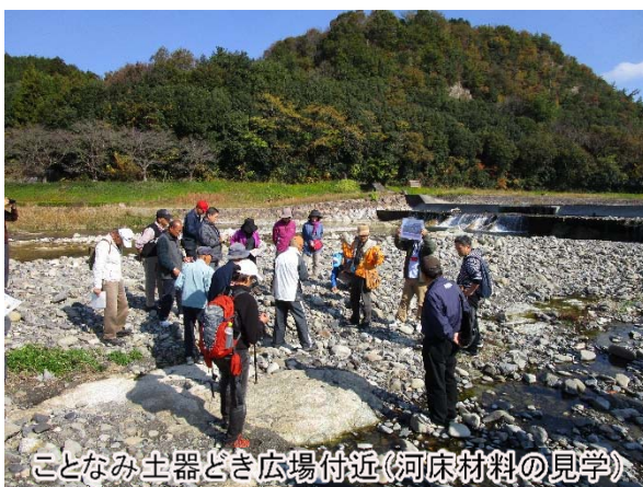
ことなみ土器とき広場付近(河床材料の見学)