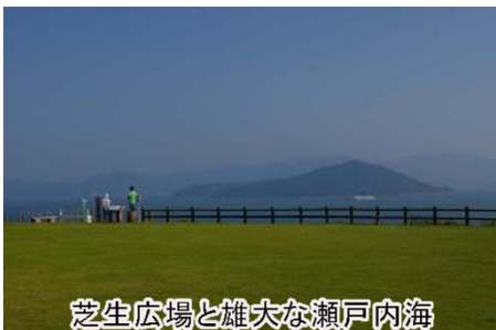
芝生広場と雄大な瀬戸内海

また、昭和63年に設立された、四国唯一のワイン工場もあり、ガラス越しにワインの製造工程を見学できるほか、ワインの試飲・購入もできます。大串半島東側には、無料開放されている海釣り公園があります。瀬戸内海を眺めながらの最高の釣りが楽しめます。