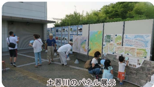
土器川のパネル展示

イベントを通じて、自然あふれる土器川を大切に守り育てる輪が広がることを願っています。