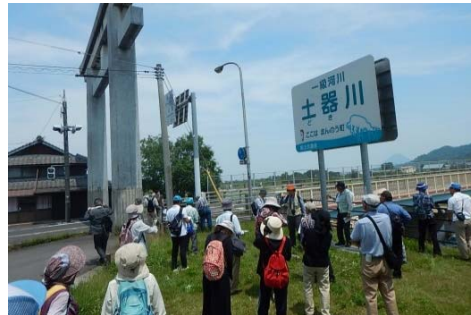
現在の金比羅街道（祓川橋）