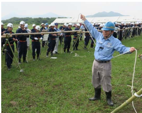
水防の基本となるロープワーク

今後も、水防活動に対する連携、河川管理者による水防活動への協力の推進を図るとともに、さらなる水防工法技術の向上に取り組んでいきます。