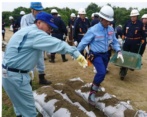
越水防止の「積み土のう工」を体験