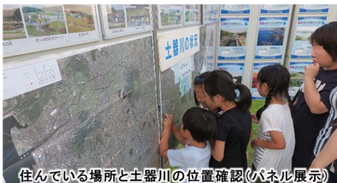
住んでいる場所と土器川の位置確認(パネル展示)

本イベントとの連携し毎年2月には地元の子供たち参加のホタル幼虫放流を行っています。これからも様々な協働による環境保全に努めていきます。