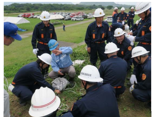
堤防侵食防止の「木流し工」を体験

土器川リバーキーパーズ通信は、皆様のご意見・ご質問に河川管理者としてお答えしていくものです。土器川に関して、気になっていること、わからないことなど、どしどしとご意見をお寄せください。