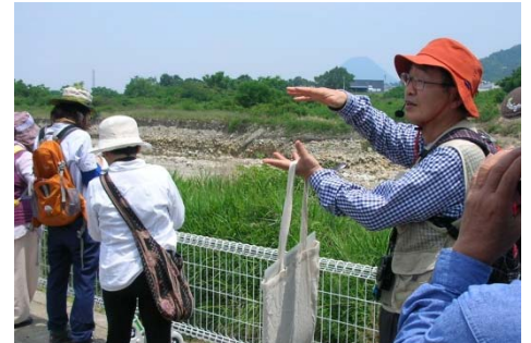
台風出水で現れた洪積層の見学