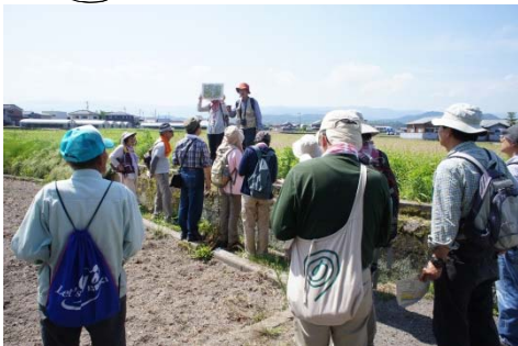
地形と地質から旧河道の流れを推測