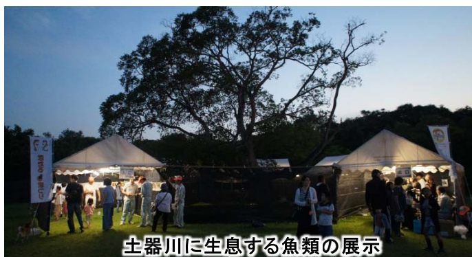
土器川に生息する魚類の展示