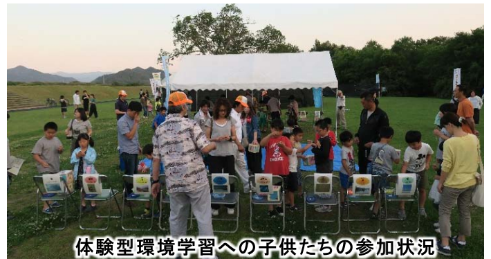
体験型環境学習への子供たちの参加状況