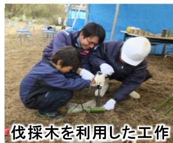
伐採木を利用した工作