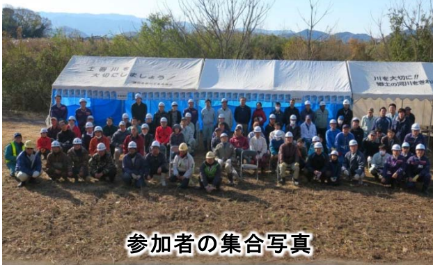
参加者の集合写真

このため、 住民と行政が協働し 、過剰に繁茂している樹木の伐採を進めることで、 土器川の利用・再生を促進 しようと、 12月10日(日) まんのう町長尾ふれあいパーク親水公園前の高水敷周辺で「 ボランティア伐採 」を実施しました。