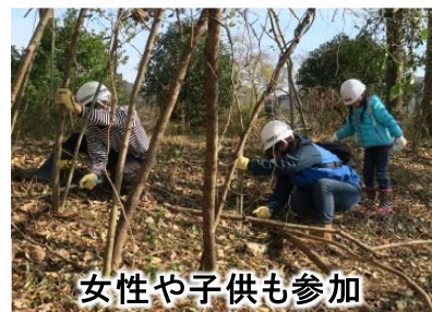
女性や子供も参加