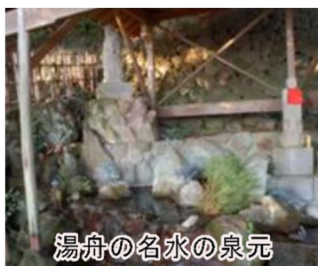
湯舟の名水の泉元

県道252号の殿川ダム下の橋を渡ってすぐ右に入ると、小豆島霊場第44番札所湯舟山蓮華寺の境内の奥に湯舟の名水があります。湯舟の名水は、湯舟山から湧き出す水で、日照りのときにも枯れることはないといわれています。ここから湧き出る水は、眼下に広がる千枚田を潤しています。水の少ない小豆島において貴重な水源として、昔から人々に大切にされてきました。湯舟の名水の下にある千枚田は、山あいにひっそりとひろがり、懐かしくも美しい眺めで、感傷的な気分と感動を同時に味わうことができます。