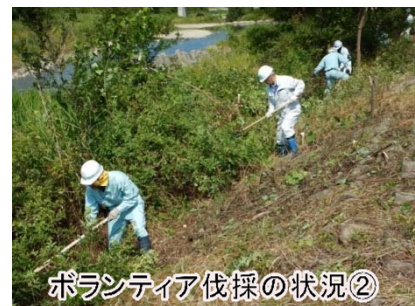
ボランティア伐採の状況②