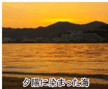
夕陽に染まった海