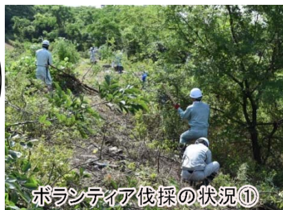
ボランティア伐採の状況①