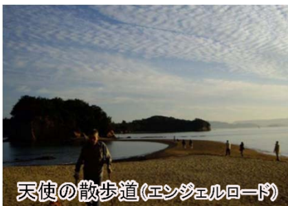
天使の散歩道(エンジェルロード)

土庄港から程近くに余島はあります。余島とは、昭和40年に埋め立てられて陸続きになった弁天島、中余島、大余島の総称で、干潮時にはトンボロが出現し、これらの島と陸地がつながります。それが天使の散歩道(エンジェルロード)と呼ばれ、この道の真ん中で手をつなぐと好きな人と結ばれるなど、ロマンチックなエピソードもあり、若者に人気のスポットです。夕陽が美しい場所で、赤く染まった幻想的な海の眺めを楽しむことができます。