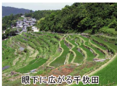
眼下に広がる千枚田