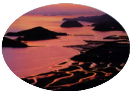
夕陽に映える水の道

「日本の夕陽百選」に選ばれた夕陽の名所でもあり、写真愛好家たちの絶好の撮影スポットとなっています。日の入りと干潮の重なる日に、カメラを持って出かければ、とっておきの一枚が撮影出来ます。