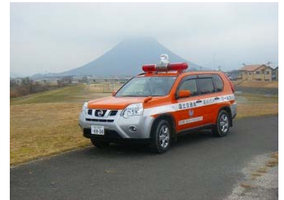
河川パトロールカー

河川巡視とは、河川が常時良好に保たれるよう、直轄管理区間を巡視して状況を把握し、河川の異常・変状及び不法占用等の状況を報告・記録等を行います。河川巡視には、日常的に川を点検する 通常の巡視 と、川が増水した時や災害や事故発生時に行なう 出水時等の巡視 があります。