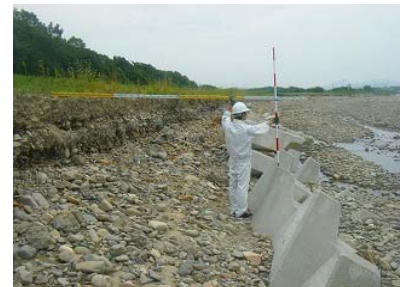
出水後被災状況報告