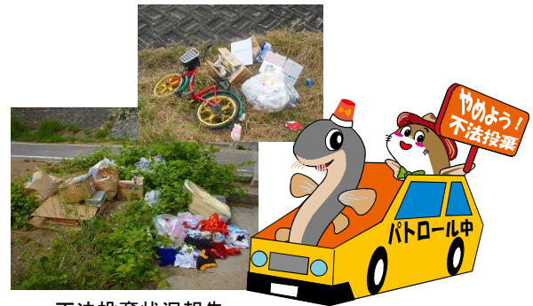
不法投棄状況報告