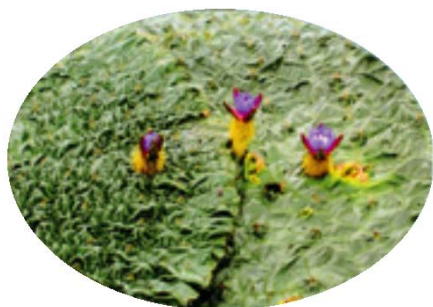
オニバスの花(善通寺市指定天然記念物)

善通寺市街近くに、オニバスの咲く池(前池)があります。オニバスは、日本で見られる水生植物のうちで最大の葉を持つ種で、環境省のレッドデータブックで絶滅危惧種に指定されるほど希少な種です。日本最南端の群生地である前池一面にオニバスが咲き乱れる様子が眺められます。オニバスの群生とともに、天気の良い日は讃岐山脈への眺望も開け、気持ちの良い空間になっています。