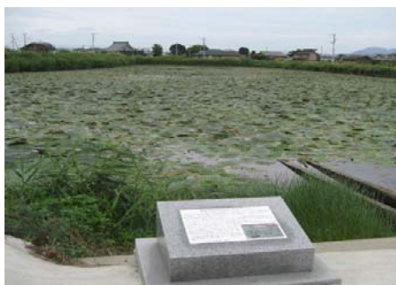
オニバスの咲く池(前池)全景