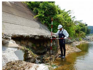
出水後被災状況報告