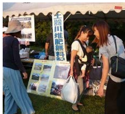
土器川堆肥無料配布