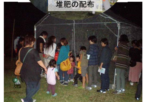
ホタルの鑑賞(数当てクイズ)