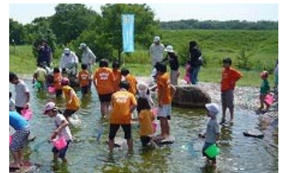
昨年度実施状況(魚のつかみどり)

土器川リバーキーパーズ通信は、皆様のご意見・ご質問に河川管理者としてお答えしていくものです。土器川に関して、気になっていること、わからないことなど、どしどしご意見をお寄せください。