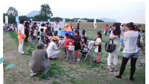
水循環の体験学習