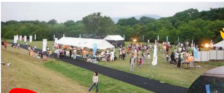
土器川ホタルまつり全景

会場では、ホタルの観賞ブース(数当てクイズ)のほか、サイコロゲーム、ヨーヨーつりなどのゲームコーナーがあり、約850人の来場者が初夏の夜のひとときを楽しみました。