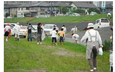
過去実施状況(土器公園)

ゴミ袋・軍手・タオルなどは、当日各集合場所に行けば、受付で受け取れます。 ゴミについては、可燃物・不燃物に分けて収集します。