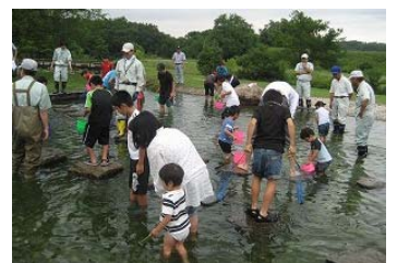
昨年度実施状況(魚のつかみどり)