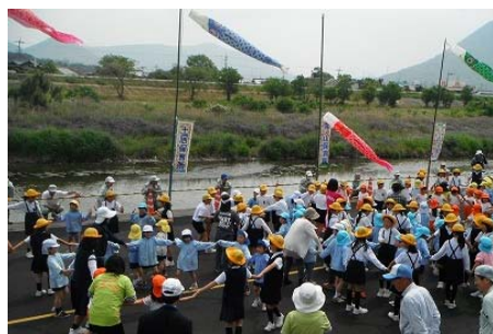
お祝いゲーム(みんなで踊ろう)

イベントでは河原の清掃やフナやワキンなど約7000匹の稚魚の放流を行い、豊かな自然と戯れながら地域を潤す川の大切さや水難事故の防止などについて学びました。