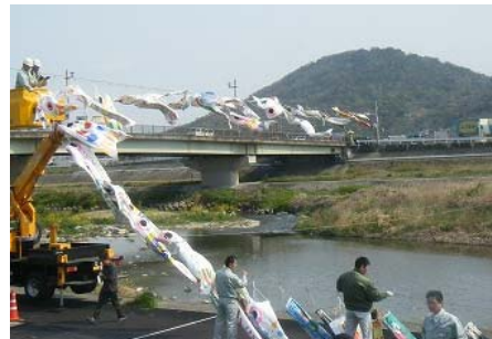
高所作業車による吊り渡し