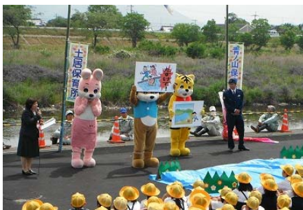
水難事故防止の劇