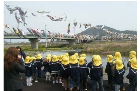
土器川を元気に泳ぐ鯉のぼり