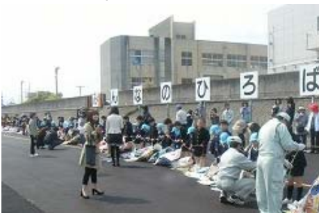
鯉のぼりを吊り下げる子どもたち

4月11日(水)、土器川の河川敷「みんなの広場」において、「鯉のぼり吊り渡し」が開催され、近隣の城東小学校と校区内の幼稚園や保育所の子供たちが手作りした約340匹の鯉のぼりを、土器川に渡らせました。この日は城東小4年生と城東幼稚園の園児計165人が参加し、国土交通省職員や丸亀市職員らと一緒に、ワイヤー2本に鯉のぼりをつり下げ、土器川を爽やかに泳ぐ鯉のぼりを見事に完成させました。