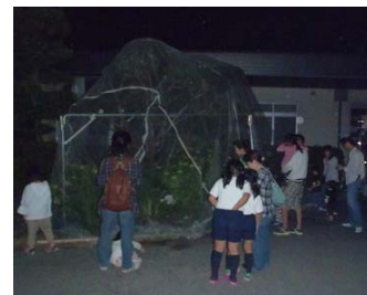
ホタルの鑑賞状況