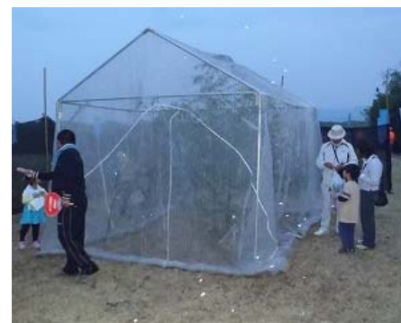
ホタルの鑑賞状況(数当てクイズ)