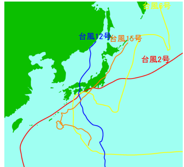
平成23年の主要台風経路図

祓川橋の水位が4.00mを越えたのは、既往最高水位 4.60mを記録した平成16年の台風23号以来です。