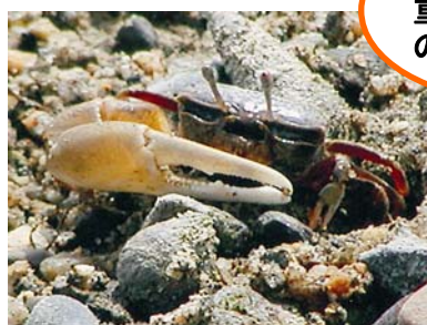
ハクセンシオマネキ(準絶滅危惧)