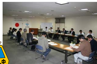
「河川愛護モニター」会議 （意見交換会）