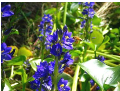
ミズアオイ(絶滅危惧Ⅰ類)