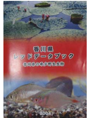
「香川県レッドデータブック」 香川県

日本でも、1991年に『日本の絶滅のおそれのある野生生物』というタイトルで環境庁(現・環境省)がレッドデータブックを作成し、2000年からはその改訂版が、植物や動物の大きなグループごとに順次発行されています。また、ほとんどの都道府県において、都道府県版のレッドデータブックが作成されているか、あるいは作成準備中です。