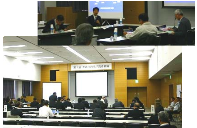
学識者会議開催状況

11月12日(金)の15:00から丸亀市保険福祉センター(ひまわりセンター)4F研修会議室におきまして、学識経験者からのご助言をいただく場として、第1回土器川流域学識者会議が開催されました。今回お伺いしました貴重なご意見を今後の河川整備計画策定に活かしていきます。