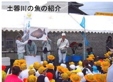
土器川の魚の紹介