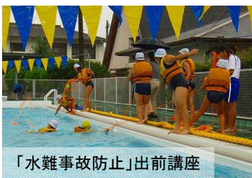
「水難事故防止」出前講座