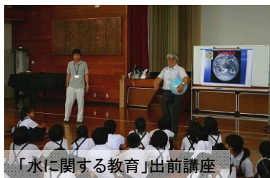
「水に関する教育」出前講座

今後も講座を希望する学校に出向き、土器川の防災や環境などについての出前講座を実施していく予定です。詳しくは、香川河川国道事務所計画課 (087-844-4315) か土器川出張所 (0877-22-8318) にお問い合わせ下さい。