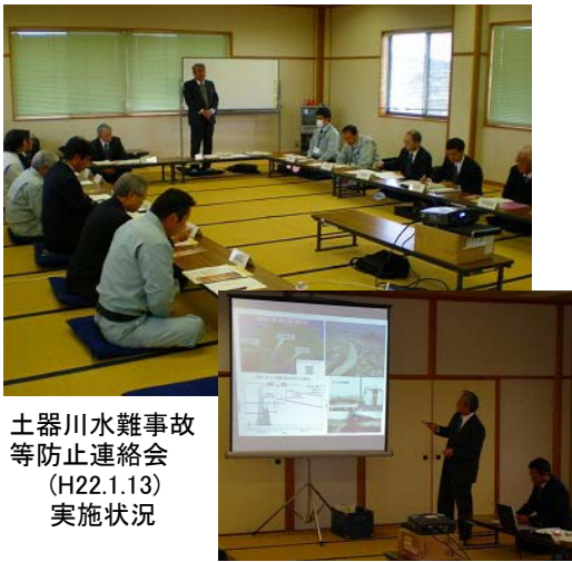
土器川水難事故等防止連絡会 (H22.1.13) 実施状況