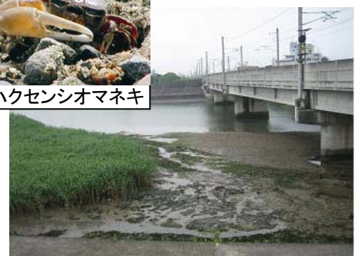
ヨシ原・干潟の状況(JR橋付近)