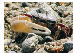
ハクセンシオマネキ