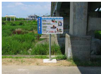
看板設置状況(祓川橋左岸)