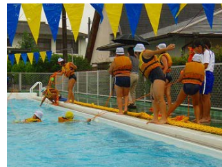
7月10日 出前講座 まんのう町立琴南小学校

このような講義や訓練をとおして、河川水難事故防止の意識を高め、水難事故を未然に防止できることを願っています。