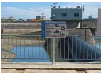
看板設置状況(潮止堰左岸)