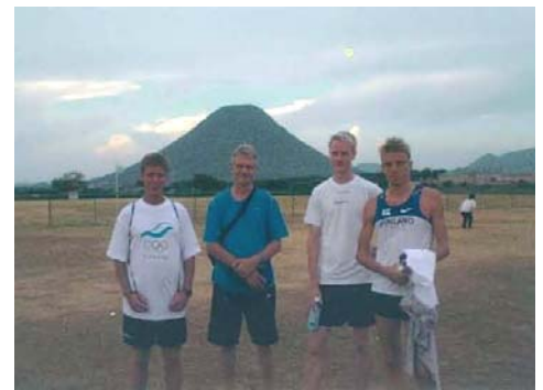
練習風景(土器川河川敷グランド)