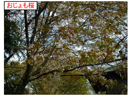
春先はもっと綺麗だと思います。