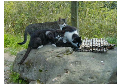
何故か猫が出迎えてくれました。