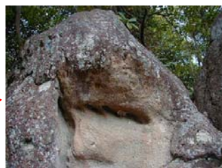
足跡と呼ばれるだけあって、よく見ると、足の指のような穴もありました。