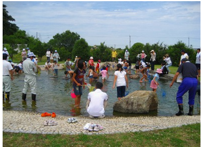
こどもの池で魚と遊ぼう