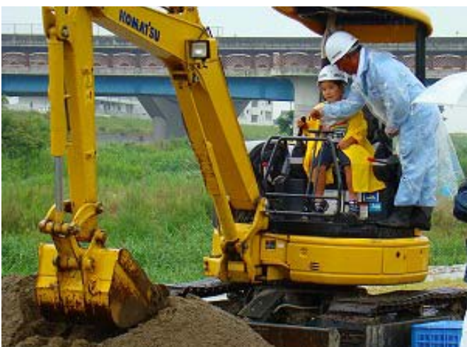
体験教室(建設機械試乗)