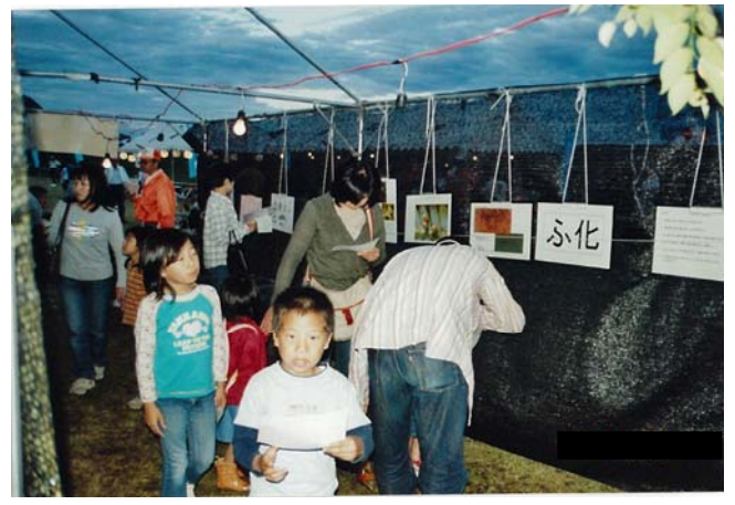
ホタルの一生探検見学状況