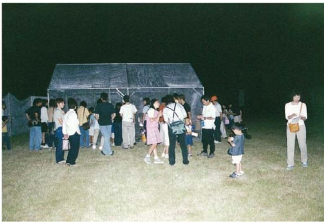
ホタルの鑑賞状況