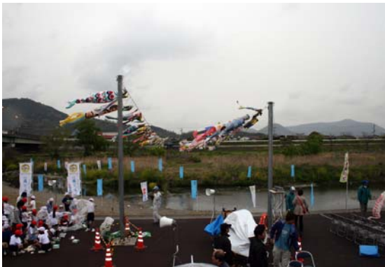
河川敷を遊泳する鯉のぼり

去る4月18日(水)、丸亀市土器町西の城東小学校前の土器川の河川敷で恒例の園児達が集う「土器川・You・遊フェスター泳げ鯉のぼりー」が開かれました。フェスタは城東小学校、城東幼稚園、青ノ山保育所、土居保育所、ふたば乳児保育園の園児、児童ら約240人が参加し、子供達で作ったこいのぼり約300匹が泳ぐ中、フォークダンスや玉入れをして楽しんだり、水難防止や土器川の淡水魚について勉強し、稚魚(フナ、ムツゴ、モクズガニ)放流などをして親睦を深めると共に河川環境美化への意識を高めました。