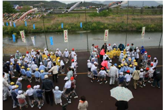
フォークダンスを楽しむ園児達