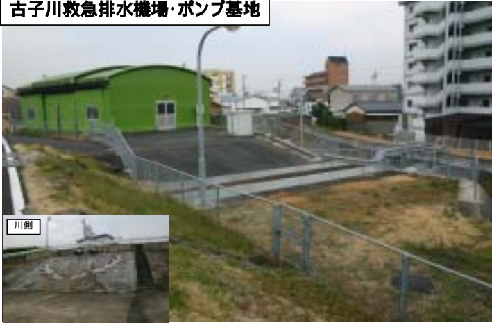
古子川救急排水機場・ポンプ基地