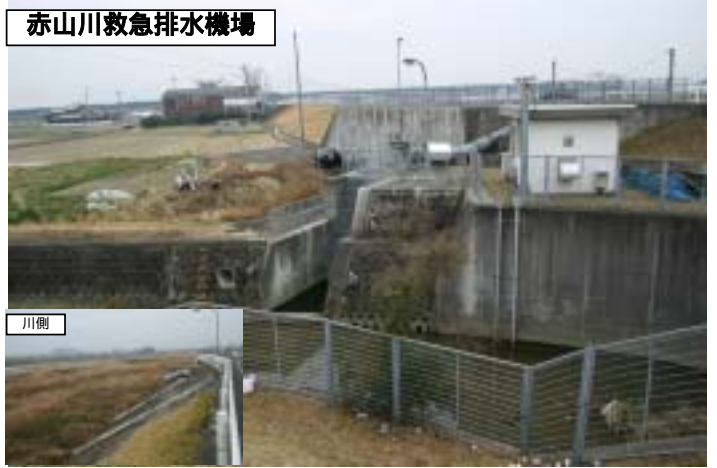
赤山川救急排水機場