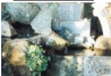
八四番:湯舟の名水