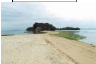
八三番:余島(天使の散歩)