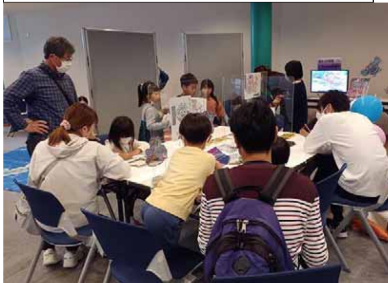
②気をつけ妖怪塗絵コーナー