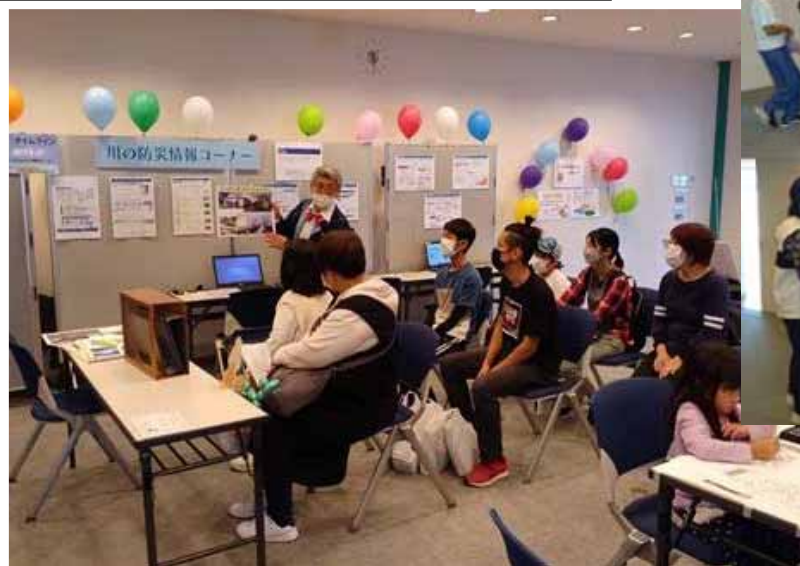
③防災クイズコーナー（避難等）