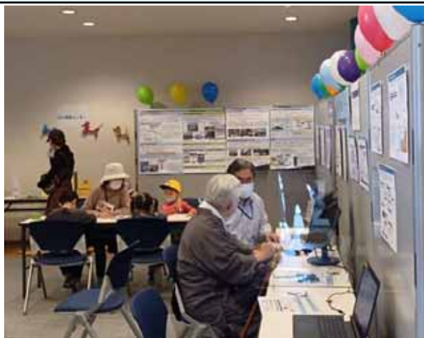
①川の防災情報コーナー パソコン等使った実体験