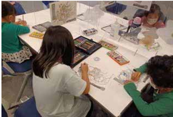
防災妖怪の塗り絵で災害を学ぶ