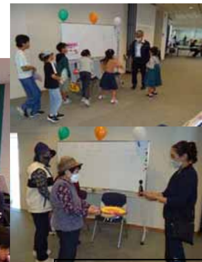
④風速計で測ってみようコーナー