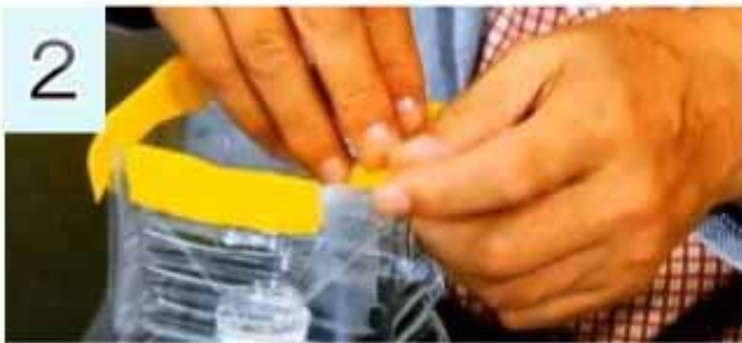
②切った上部を、逆さに差し込んでテープで止めます。