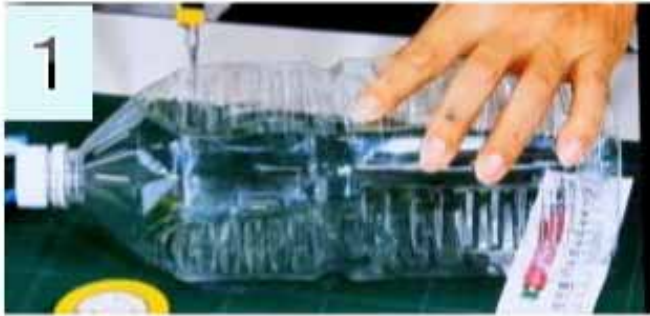
①2リットルペットボトルの上部を切り