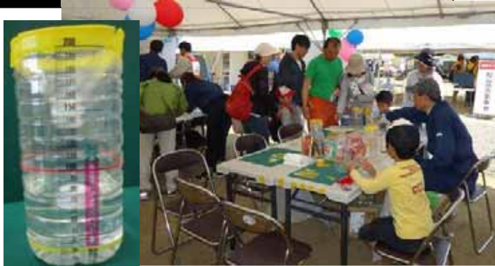
ローテク防災・ペットボトル雨量計