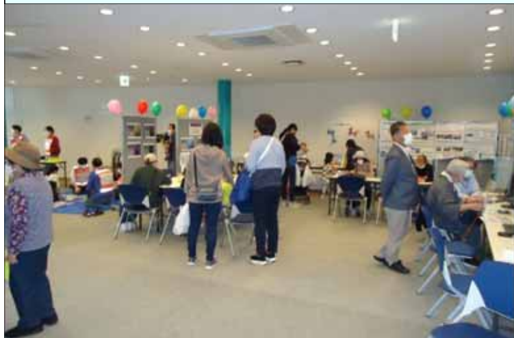
町民1万2千人のうち、2千人がイベントに参加、うち5百人が来場