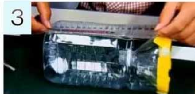
③ 1ミリ単位が目盛りをつければできあがり。