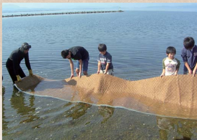
【鳥取県・島根県】中海 NPO法人 未来守りネットワーク

河川協力団体によるアマモ場再生への取り組み。作業に地域の子ども達も参加することで、自分達が住む地域への関心や、自然環境に対する意識の向上につながっている。