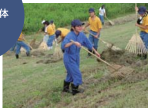
河川の除草・集草