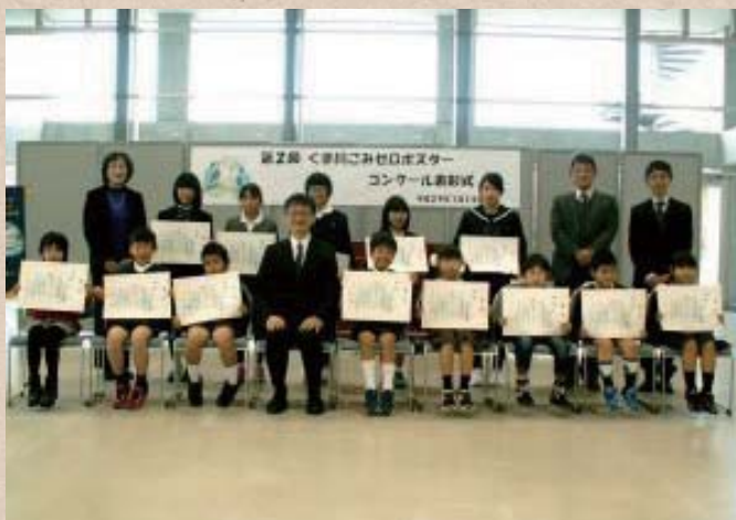
【熊本県】球磨川 次世代のためにがんばる会

河川協力団体は市民と河川管理者、双方の立場を理解し、活動しています。市民と河川管理者の間に立つことで、お互いの視点や想いを融合することが出来ます。その結果、河川の利活用や維持・管理につながります。