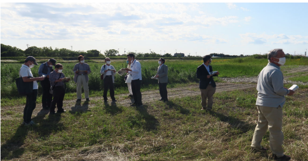
会議後に土器川で打合せ