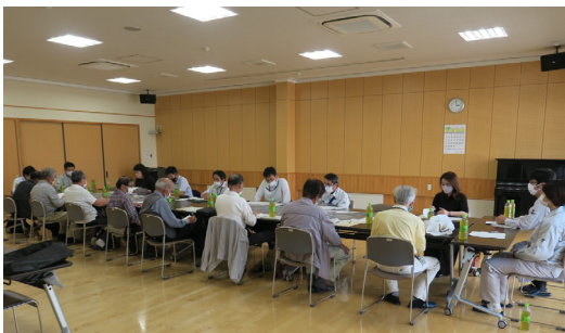
河川愛護モニター会議