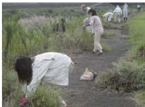
外来植物調査・駆除

水生生物の調査研究や、生態系を維持するために外来生物の駆除活動などを行い、河川の環境を維持します。