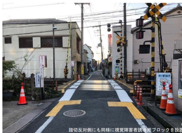
踏切反対側にも同様に視覚障害者誘導用ブロックを設置