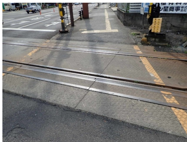
塩上町踏切（東進側）