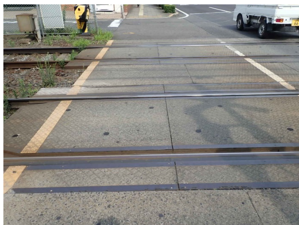
福田町第四踏切（東進側）