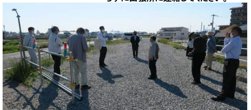
会議後に土器川で打合せ