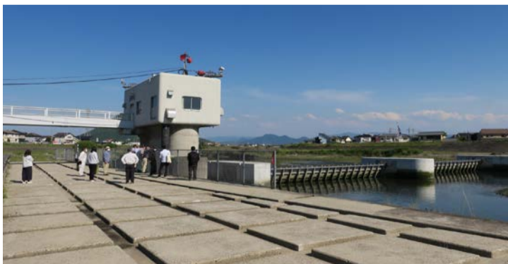
河川愛護モニター会議