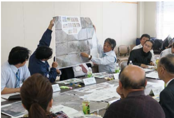
河川愛護モニター会議