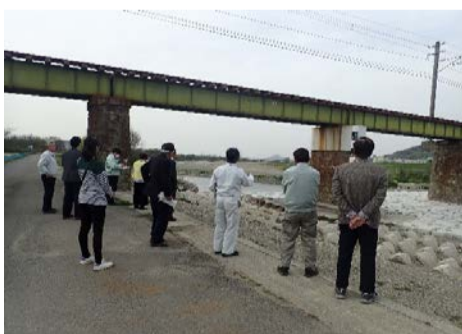
会議後に整備箇所の現地説明