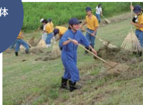
河川の除草・集草