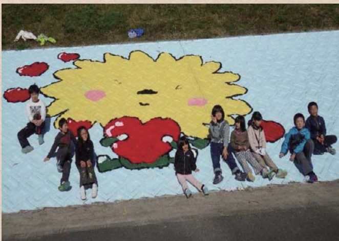
【徳島県】桑野川 横見町をきれいにする会

誰でも、いつでも気軽に近づく快適な河川空間は維持・管理が重要です。河川協力団体が実際の作業を行うにあたって、河川管理者と河川協力団体が協力して計画を作成するなど、両者が一体となって安心・安全な河川空間の維持・管理の質の向上につながっています。