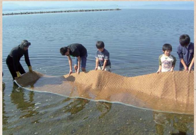
【鳥取県・島根県】中海 NPO法人 未来守りネットワーク

河川協力団体によるアマモ場再生への取り組み。作業に地域の子ども達も参加することで、自分達が住む地域への関心や、自然環境に対する意識の向上につながっている。