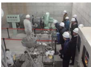
河川・ダム管理状況説明

過去の水害などの伝承や、防災に関わる活動、またダムなど河川にある施設での説明会などを実施します。