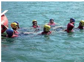
水辺の安全利用講習会

河川や河川空間を使って、観察会や、安全に河川を利用するための講習会などを実施します。