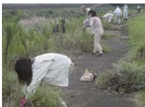
外来植物調査・駆除

水生生物の調査研究や、生態系を維持するために外来生物の駆除活動などを行い、河川の環境を維持します。