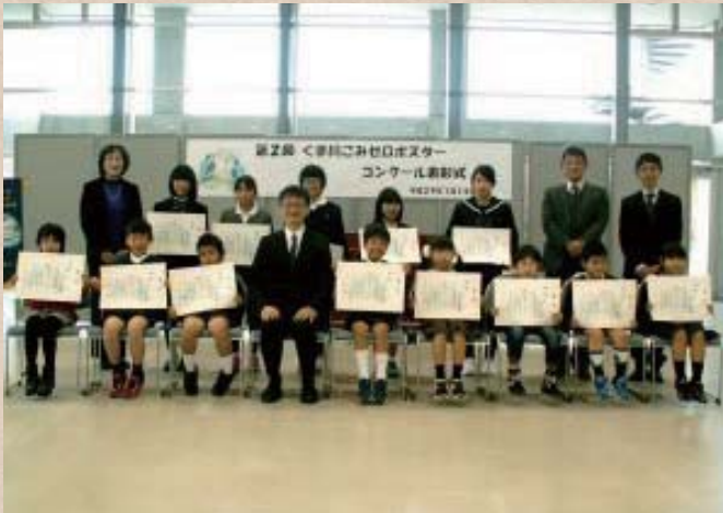
【熊本県】球磨川 次世代のためにがんばる会

河川協力団体は市民と河川管理者、双方の立場を理解し、活動しています。市民と河川管理者の間に立つことで、お互いの視点や想いを融合することが出来ます。その結果、河川の利活用や維持・管理につながります。