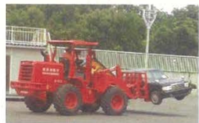
車両移動のための具体的方策 （例：ホイールローダーによる移動）