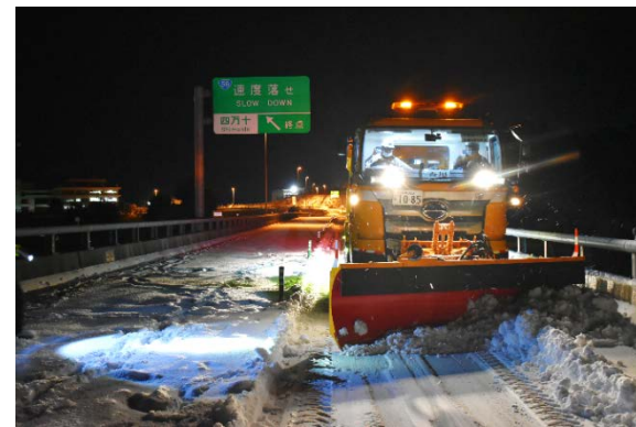
※令和3年1月降雪における高知県四十万市内での除雪応援活動状況