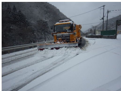
※令和3年2月降雪における猪ノ鼻での除雪活動状況