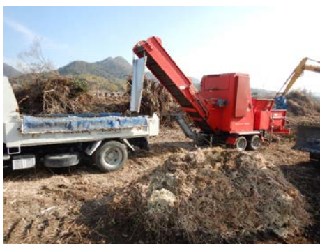
伐採した樹木をチップ化