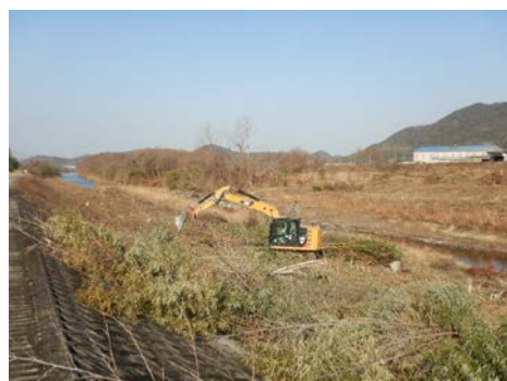
河川内樹木の伐採状況