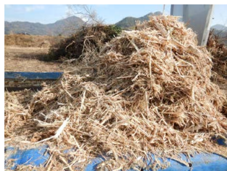
チップ化した樹木を堆肥化