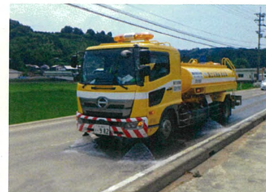
※平成30年7月豪雨時の大洲市内における活動状況