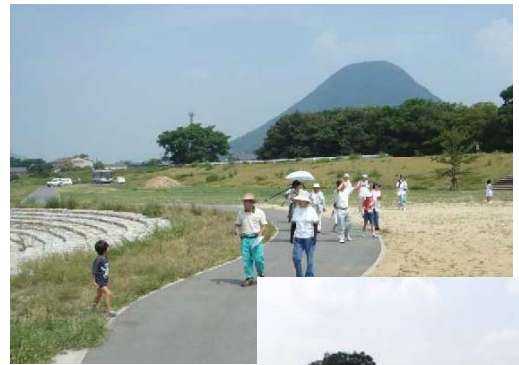
飯山 DOKI! 土器パーク