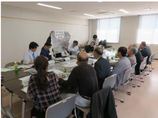
河川愛護モニター懇談会