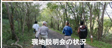
現地説明会の状況