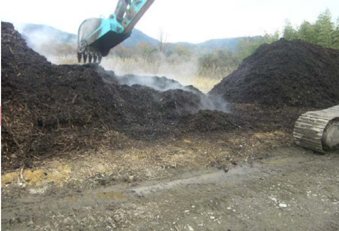
⑤熟成期間中に数回攪拌します