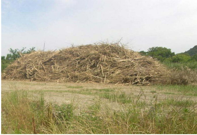
①支障となる竹の伐採(収集後)