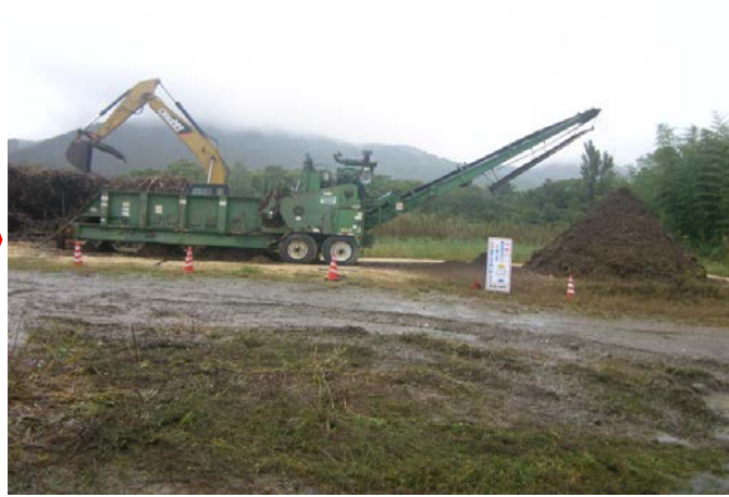
②竹をチップ化します