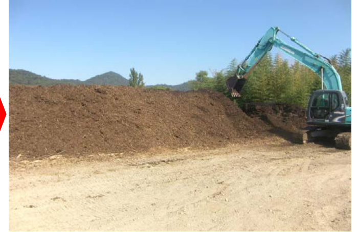
③チップ材に発酵促進剤を混合します