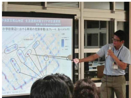
ワークショップでのビッグデータ分析結果の活用