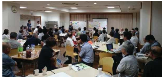
新潟市日和山小ワークショップの開催状況