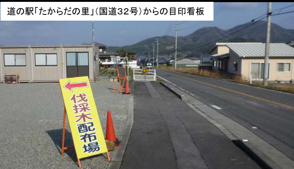
道の駅「たからだの里」(国道32号)からの目印看板