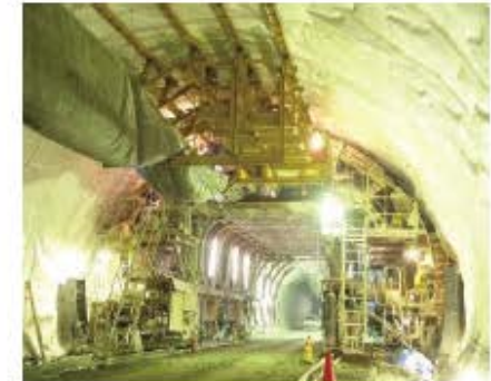
全断面スライドセトル

トンネルをコンクリートで仕上げるための鋼製の大きな型枠です。一回の施工で約10mの覆工コンクリートを打設することができます。