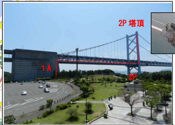
現場見学：北備瀬戸大橋