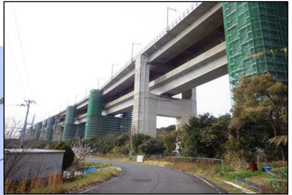
現場見学：樫石島高架橋