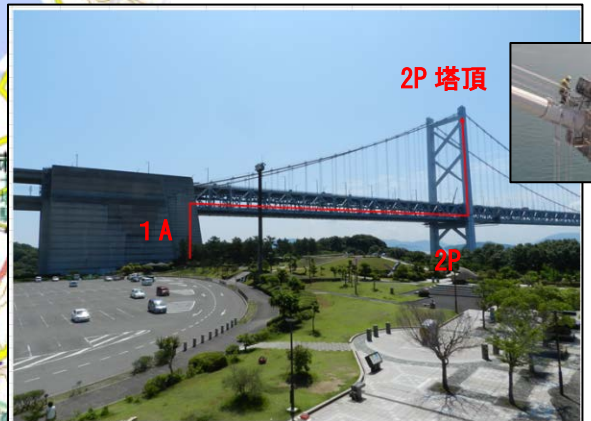
現場見学：北備瀬戸大橋